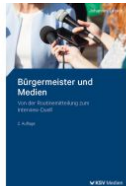
Bürgermeister und Medien Ladenpreis: 25,70EUR