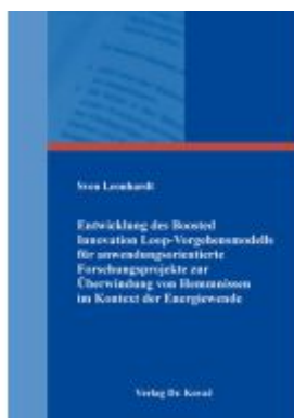
Entwicklung des Boosted Innovation Loop- Vorgehensmodells für anwendungsorientierte Forschungsprojekte zur Überwindung von Hemmnissen im Kontext der Energiewende Ladenpreis: 102,60EUR