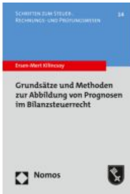
Grundsätze und Methoden zur Abbildung von Prognosen im Bilanzsteuerrecht Ladenpreis: 86,40EUR