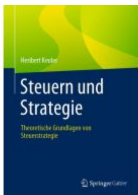
Steuern und Strategie Ladenpreis: 77,09EUR