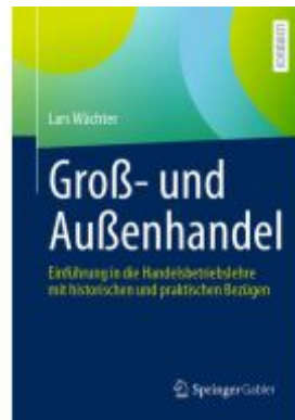
Groß- und Außenhandel Ladenpreis: 51,39EUR