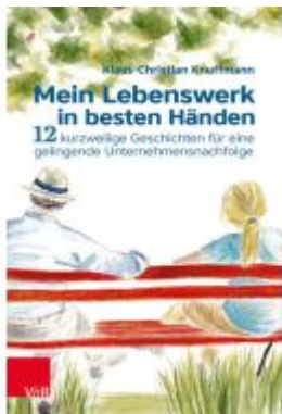
Mein Lebenswerk in besten Händen Ladenpreis: 26,00EUR

Wir haben andere Produkte gefunden, die Ihnen gefallen könnten!