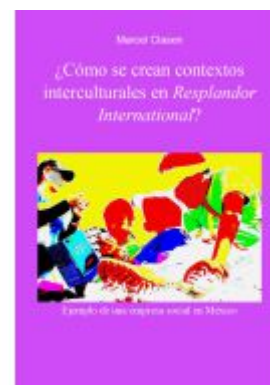
¿Cómo se crean contextos interculturales en Resplandor International? Ladenpreis: 15,50EUR