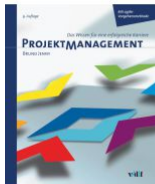
Projektmanagement Ladenpreis: 81,30EUR