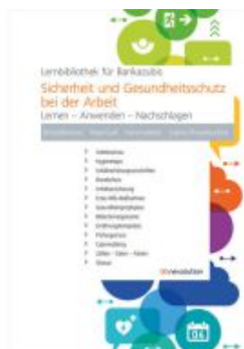
Sicherheit und Gesundheitsschutz bei der Arbeit Ladenpreis: 28,80EUR