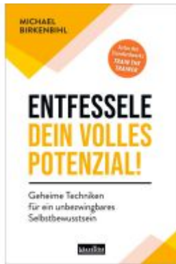
Entfessele dein volles Potenzial! Ladenpreis: 20,60EUR