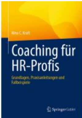
Coaching für HR-Profis Ladenpreis: 41,11EUR