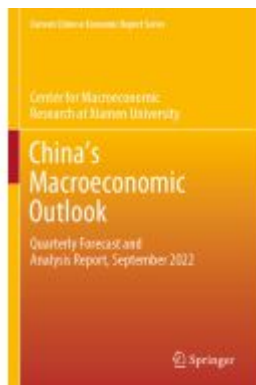
China's Macroeconomic Outlook Ladenpreis: 120,99EUR