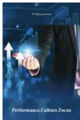
Performance.Culture.Focus Ladenpreis: 7,20EUR