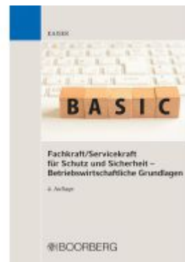
Fachkraft/Servicekraft für Schutz und Sicherheit - Betriebswirtschaftliche Grundlagen Ladenpreis: 33,50EUR