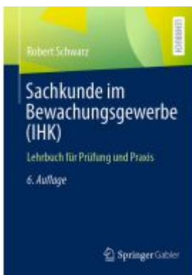
Sachkunde im Bewachungsgewerbe (IHK) Ladenpreis: 20,55EUR