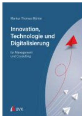
Innovation, Technologie und Digitalisierung Ladenpreis: 30,80EUR