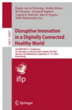
Disruptive Innovation in a Digitally Connected Healthy World Ladenpreis: 98,99EUR