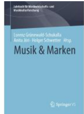
Musik & Marken Ladenpreis: 71,95EUR