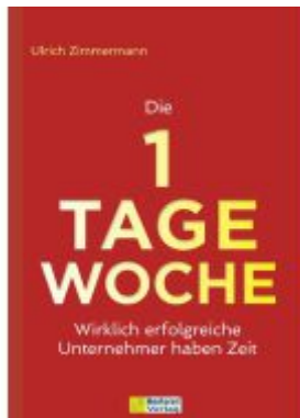
Die 1-Tage-Woche Ladenpreis: 25,70EUR