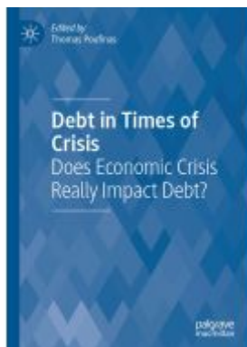
Debt in Times of Crisis Ladenpreis: 175,99EUR