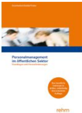
Personalmanagement im öffentlichen Sektor Ladenpreis: 32,90EUR

Wir haben andere Produkte gefunden, die Ihnen gefallen könnten!