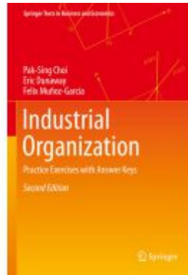
Industrial Organization Ladenpreis: 142,99EUR