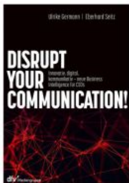
Disrupt your Communication! Ladenpreis: 49,40EUR