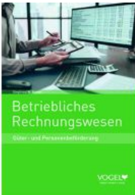
Betriebliches Rechnungswesen Ladenpreis: 41,80EUR