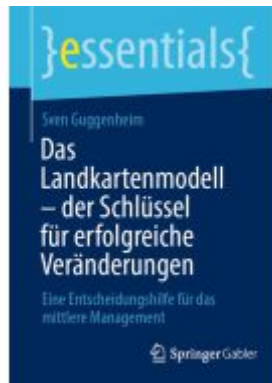
Das Landkartenmodell – der Schlüssel für erfolgreiche Veränderungen Ladenpreis: 15,41EUR