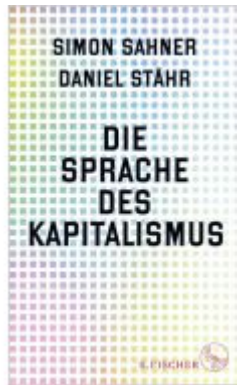
Die Sprache des Kapitalismus Ladenpreis: 24,70EUR