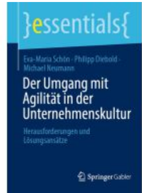
Der Umgang mit Agilität in der Unternehmenskultur Ladenpreis: 15,41EUR