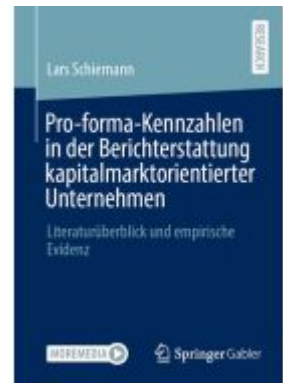
Pro-forma-Kennzahlen in der Berichterstattung kapitalmarktorientierter Unternehmen Ladenpreis: 77,09EUR