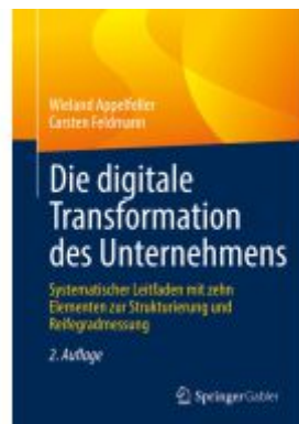
Die digitale Transformation des Unternehmens Ladenpreis: 61,68EUR