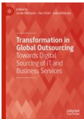
Transformation in Global Outsourcing Ladenpreis: 87,99EUR