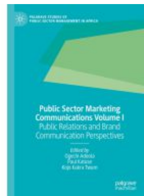
Public Sector Marketing Communications Volume I Ladenpreis: 109,99EUR