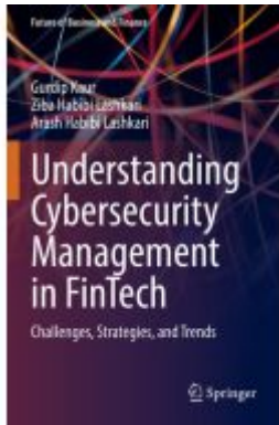
Understanding Cybersecurity Management in FinTech Ladenpreis: 65,99EUR