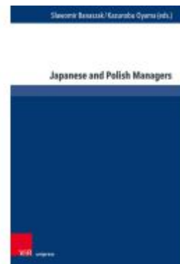
Japanese and Polish Managers Ladenpreis: 42,00EUR