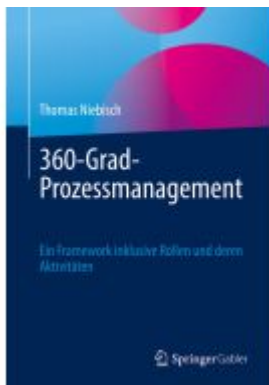
360-Grad-Prozessmanagement Ladenpreis: 56,53EUR