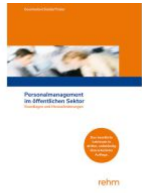
Personalmanagement im öffentlichen Sektor Ladenpreis: 32,90EUR