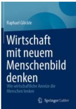
Wirtschaft mit neuem Menschenbild denken Ladenpreis: 56,53EUR