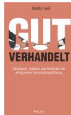
Gut verhandelt Ladenpreis: 30,90EUR