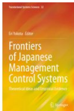
Frontiers of Japanese Management Control Systems Ladenpreis: 164,99EUR