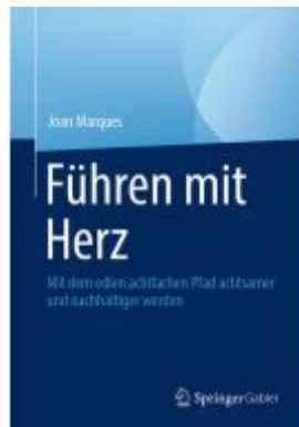
Führen mit Herz Ladenpreis: 39,06EUR