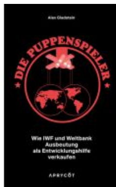
Die Puppenspieler Ladenpreis: 21,60EUR