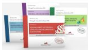
Personalfachkaufleute - Lernkarten Komplettpaket Handlungsbereich 1 bis 4 Ladenpreis: 128,95EUR