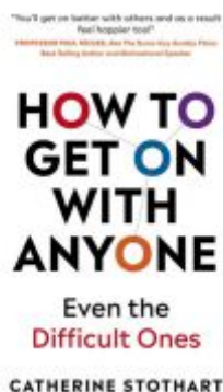
How To Get On With Anyone Ladenpreis: 18,51EUR