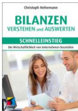
Bilanzen verstehen und auswerten - Schnelleinstieg Ladenpreis: 20,60EUR