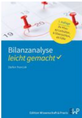
Bilanzanalyse – leicht gemacht Ladenpreis: 18,40EUR