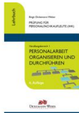
Personalfachkaufleute - Lehrbuch Handlungsbereich 1: Personalarbeit organisieren und führen Ladenpreis: 33,95EUR