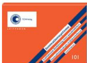
Innovationssysteme Ladenpreis: 257,10EUR