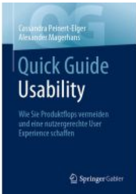
Quick Guide Usability Ladenpreis: 39,06EUR