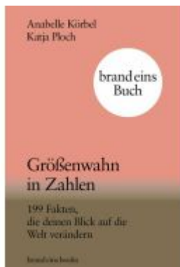
Größenwahn in Zahlen Ladenpreis: 20,60EUR

Wir haben andere Produkte gefunden, die Ihnen gefallen könnten!