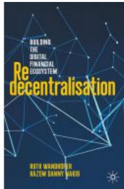
Redecentralisation Ladenpreis: 65,99EUR