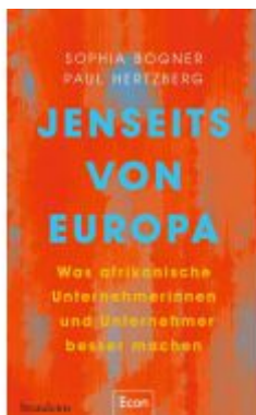
Jenseits von Europa Ladenpreis: 25,70EUR