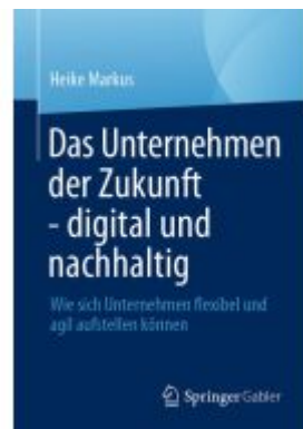
Das Unternehmen der Zukunft - digital und nachhaltig Ladenpreis: 51,39EUR