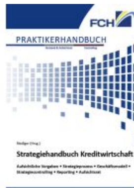
Strategiehandbuch Kreditwirtschaft Ladenpreis: 128,50EUR