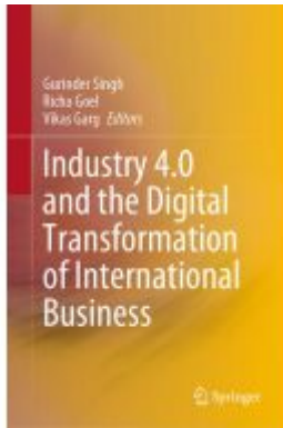
Industry 4.0 and the Digital Transformation of International Business Ladenpreis: 175,99EUR