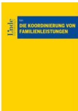
Die Koordinierung von Familienleistungen Ladenpreis: 48,00EUR