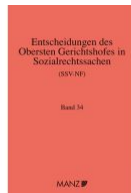
Entscheidungen des obersten Gerichtshofes in Sozialrechtssachen SSV- NF Ladenpreis: 322,00EUR