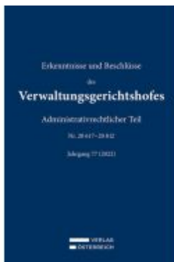
Erkenntnisse und Beschlüsse des Verwaltungsgerichtshofes Ladenpreis: 479,00EUR