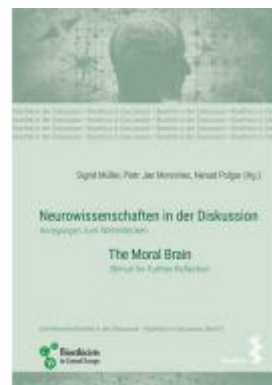
Neurowissenschaften in der Diskussion/Neurosciences in discussion Ladenpreis: 24,90EUR