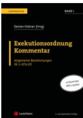
Exekutionsordnung Kommentar - Band I Ladenpreis: 196,00EUR