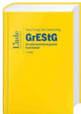
GrESTG | Grunderwerbsteuergesetz Ladenpreis: 260,00EUR