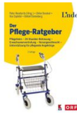
Der Pflege-Ratgeber Ladenpreis: 29,90EUR