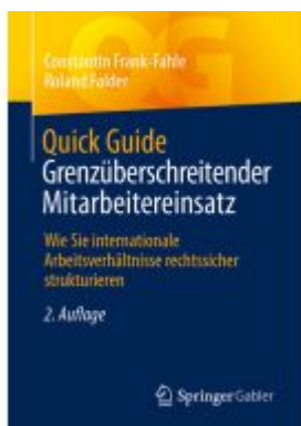
Quick Guide Grenzüberschreitender Mitarbeitereinsatz Ladenpreis: 28,77EUR