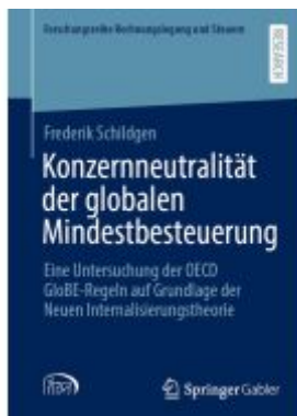
Konzernneutralität der globalen Mindestbesteuerung Ladenpreis: 82,23EUR