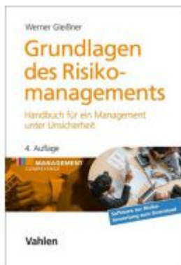
Grundlagen des Risikomanagements Ladenpreis: 66,90EUR

Wir haben andere Produkte gefunden, die Ihnen gefallen könnten!