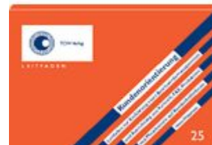
Kundenorientierung Ladenpreis: 257,10EUR