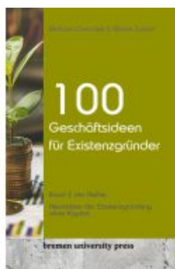
100 Geschäftsideen für Existenzgründer Ladenpreis: 20,50EUR