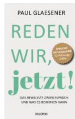
Reden wir, jetzt Ladenpreis: 22,00EUR