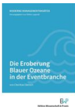
Die Eroberung Blauer Ozeane in der Eventbranche. Ladenpreis: 41,10EUR