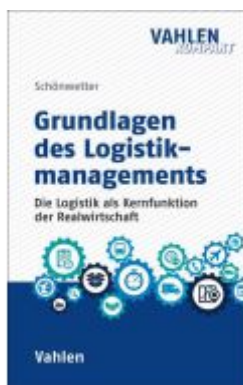
Grundlagen des Logistikmanagements Ladenpreis: 30,70EUR