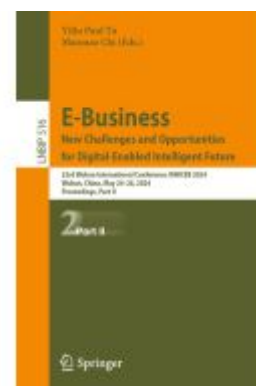
E-Business. New Challenges and Opportunities for Digital-Enabled Intelligent Future Ladenpreis: 81,39EUR