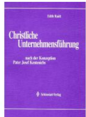
Christliche Unternehmensführung Ladenpreis: 23,70EUR