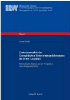
Emissionsrechte des Europäischen Emissionshandelsystems im IFRS- Abschluss Ladenpreis: 101,60EUR