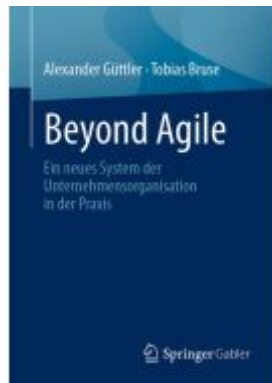
Beyond Agile Ladenpreis: 35,97EUR