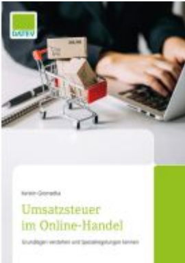
Umsatzsteuer im Online-Handel Ladenpreis: 22,66EUR