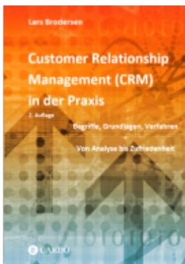
Customer Relationship Management (CRM) in der Praxis Ladenpreis: 29,90EUR