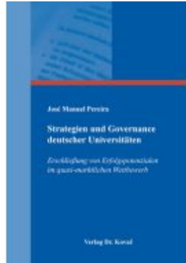
Strategien und Governance deutscher Universitäten Ladenpreis: 99,60EUR