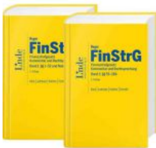
FinStrG | Finanzstrafgesetz - Paket Bd. 1+2 Ladenpreis: 348,00 EUR