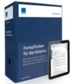
Formpflichten für das Notariat Ladenpreis: 239,80 EUR