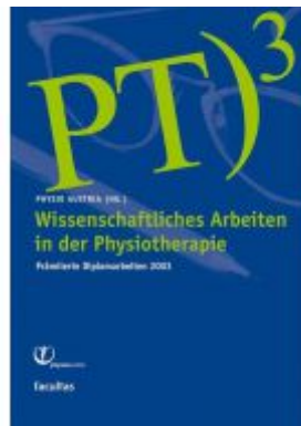
Wissenschaftliches Arbeiten in der Physiotherapie Ladenpreis: 29,90 EUR