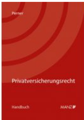
Privatversicherungsrecht Ladenpreis: 74,00 EUR