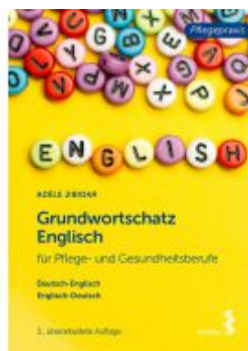
Grundwortschatz Englisch für Pflege- und Gesundheitsberufe Ladenpreis: 22,90 EUR