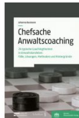
Chefsache Anwaltscoaching Ladenpreis: 83,00 EUR