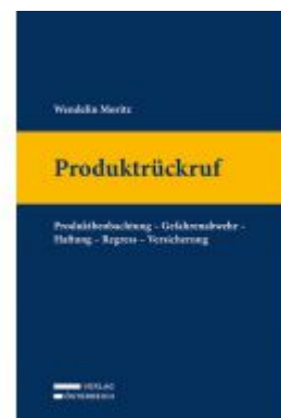
Produktrückruf Ladenpreis: 129,00 EUR