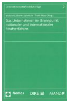
Das Unternehmen im Brennpunkt nationaler und internationaler Strafverfahren Ladenpreis: 64,00 EUR