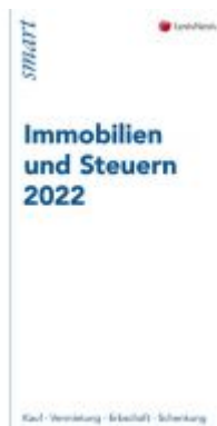
Immobilien und Steuern 2022 Ladenpreis: 12,00 EUR