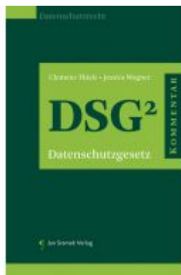
SET DSGVO-Kommentar und Praxiskommentar zum DSG 2 Ladenpreis: 278,00 EUR