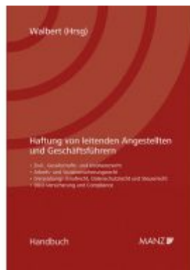
Haftung von leitenden Angestellten und Geschäftsführern Ladenpreis: 98,00 EUR