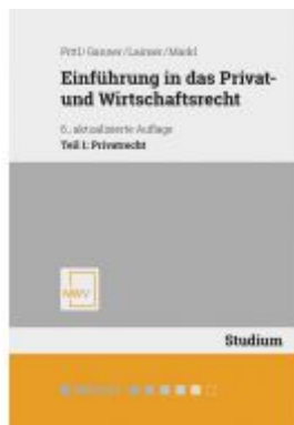
Einführung in das Privat- und Wirtschaftsrecht Ladenpreis: 44,00 EUR