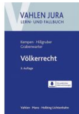
Völkerrecht Ladenpreis: 35,90 EUR