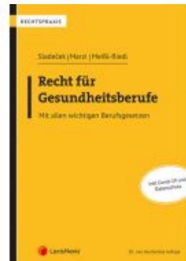
Recht für Gesundheitsberufe Ladenpreis: 48,00 EUR