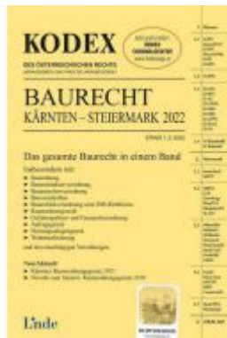
KODEX Baurecht Kärnten - Steiermark 2022 Ladenpreis: 62,00 EUR