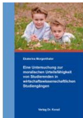
Eine Untersuchung zur moralischen Urteilsfähigkeit von Studierenden in wirtschaftswissenschaftlichen Studiengängen