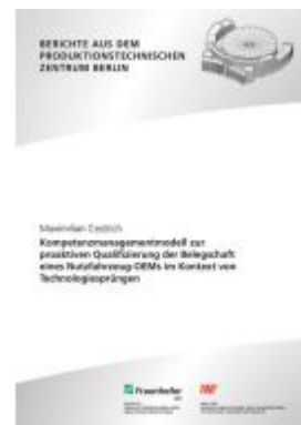
Kompetenzmanagementmodell zur proaktiven Qualifizierung der Belegschaft eines Nutzfahrzeug-OEMs im Kontext von Technologiesprüngen Ladenpreis: 83,30EUR