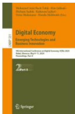
Digital Economy. Emerging Technologies and Business Innovation