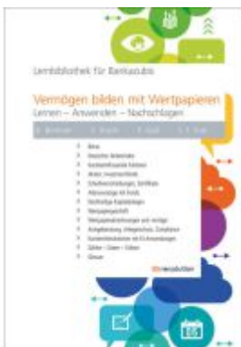
Vermögen bilden mit Wertpapieren