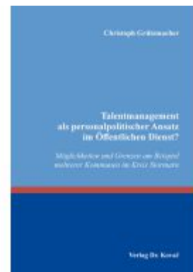
Talentmanagement als personalpolitischer Ansatz im Öffentlichen Dienst?