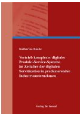
Vertrieb komplexer digitaler Produkt-Service-Systeme im Zeitalter der digitalen Servitization in produzierenden Industrieunternehmen Ladenpreis: 101,60EUR