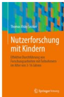
Nutzerforschung mit Kindern Ladenpreis: 23,63EUR