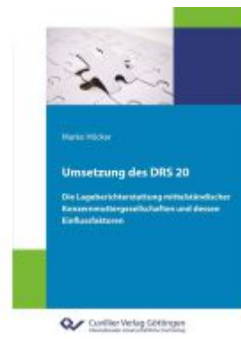
Umsetzung des DRS 20 Ladenpreis: 71,90EUR