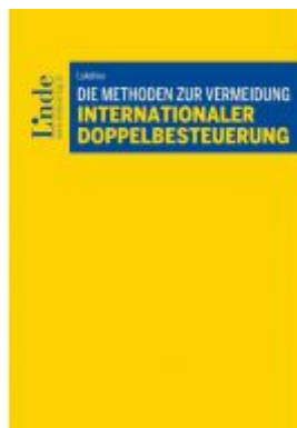
Die Methoden zur Vermeidung internationaler Doppelbesteuerung Ladenpreis: 76,00 EUR