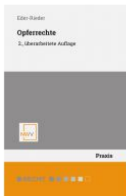
Opferrechte Ladenpreis: 48,00 EUR