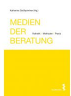
Medien der Beratung Ladenpreis: 6,90 EUR