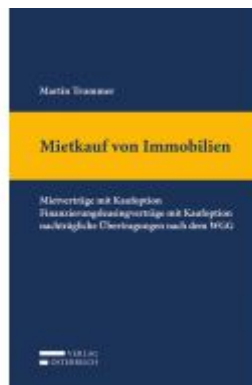
Mietkauf von Immobilien Ladenpreis: 109,00 EUR