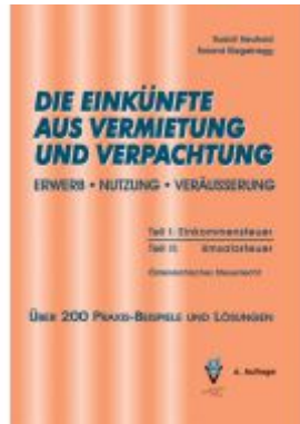
DIE EINKÜNFTE AUS VERMIETUNG UND VERPACHTUNG Ladenpreis: 63,80 EUR