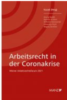
Arbeitsrecht in der Coronakrise Ladenpreis: 32,00 EUR

Wir haben andere Produkte gefunden, die Ihnen gefallen könnten!