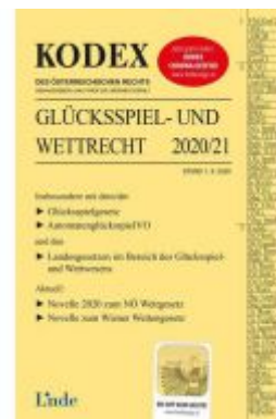
KODEX Glücksspiel- und Wettrecht 2020/21 Ladenpreis: 68,00 EUR