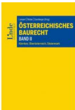
Österreichisches Baurecht Band II Ladenpreis: 39,00 EUR