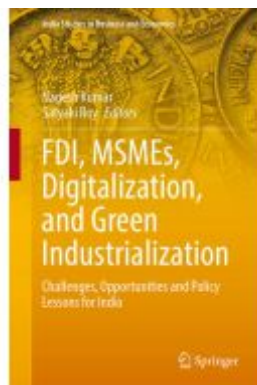
FDI, MSMEs, Digitalization, and Green Industrialization Ladenpreis: 219,99EUR