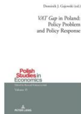
'VAT Gap' in Poland: Policy Problem and Policy Response Ladenpreis: 61,60EUR