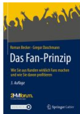
Das Fan-Prinzip Ladenpreis: 51,39EUR