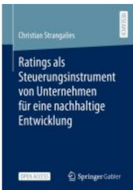
Ratings als Steuerungsinstrument von Unternehmen für eine nachhaltige Entwicklung Ladenpreis: 43,99EUR