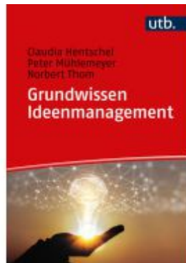
Grundwissen Ideenmanagement Ladenpreis: 20,50EUR