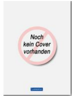
Christliche Identität von Einrichtungen Ladenpreis: 25,70EUR