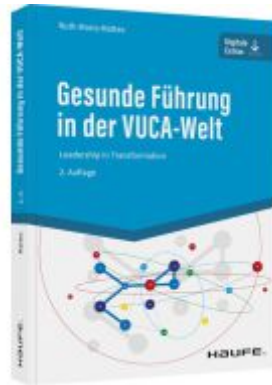
Gesunde Führung in der VUCA-Welt Ladenpreis: 41,10EUR