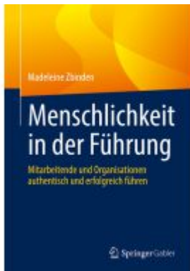
Menschlichkeit in der Führung Ladenpreis: 56,53EUR