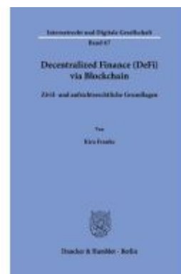
Decentralized Finance (DeFi) via Blockchain Ladenpreis: 113,00EUR