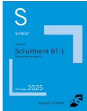
Skript Schuldrecht BT 1 Ladenpreis: 23,60EUR