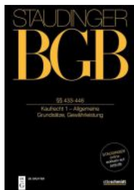
§§ 433-448 Ladenpreis: 449,00EUR