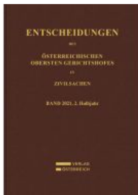
Entscheidungen des Obersten Gerichtshofes in Zivilsachen Ladenpreis: 169,00EUR