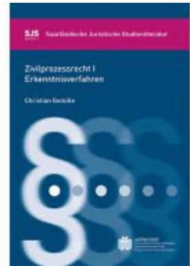
Zivilprozessrecht 1 Ladenpreis: 16,00EUR