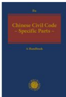
Chinese Civil Code - The Specific Parts - Ladenpreis: 215,90EUR

Wir haben andere Produkte gefunden, die Ihnen gefallen könnten!