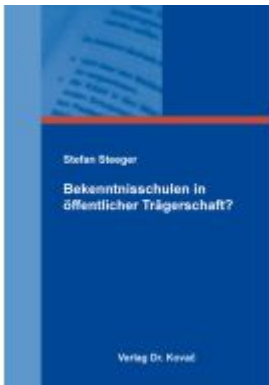
Bekenntnisschulen in öffentlicher Trägerschaft? Ladenpreis: 81,10EUR