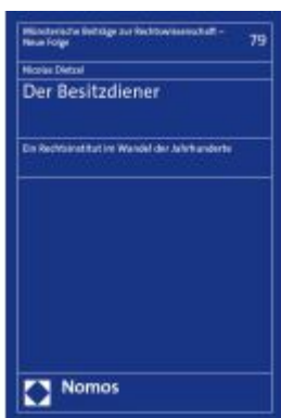
Der Besitzdiener Ladenpreis: 86,40EUR