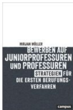
Bewerben auf Juniorprofessuren und Professuren Ladenpreis: 27,80EUR