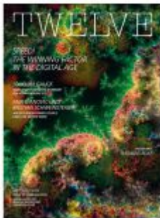
TWELVE 2023 Ladenpreis: 18,50EUR