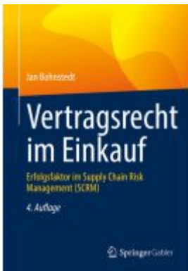
Vertragsrecht im Einkauf Ladenpreis: 51,39EUR