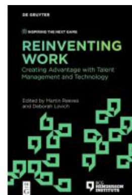
Reinventing Work Ladenpreis: 25,95EUR