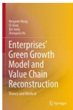
Enterprises' Green Growth Model and Value Chain Reconstruction Ladenpreis: 109,99EUR