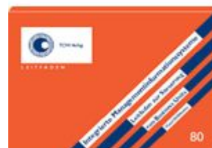
Integrierte Managementinformationssysteme Ladenpreis: 257,10EUR