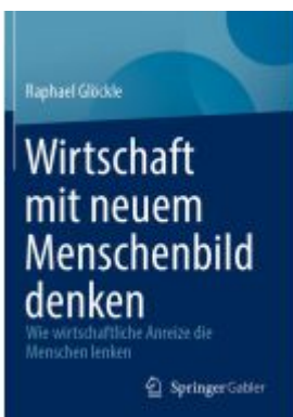
Wirtschaft mit neuem Menschenbild denken Ladenpreis: 56,53EUR