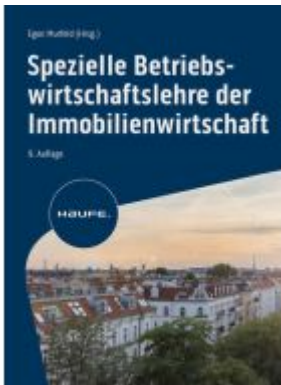
Spezielle Betriebswirtschaftslehre der Immobilienwirtschaft Ladenpreis: 72,00EUR