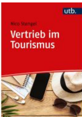
Vertrieb im Tourismus Ladenpreis: 25,60EUR

Wir haben andere Produkte gefunden, die Ihnen gefallen könnten!