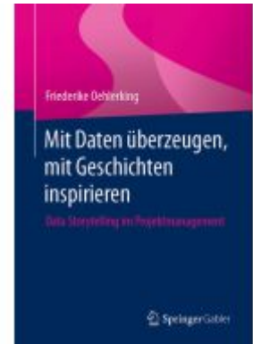
Mit Daten überzeugen, mit Geschichten inspirieren Ladenpreis: 41,11EUR