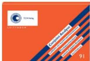
Conjoint Analyse Ladenpreis: 257,10EUR