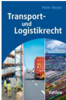
Transport- und Logistikrecht Ladenpreis: 30,70EUR