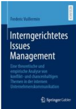
Intergerichtetes Issues Management Ladenpreis: 77,09EUR