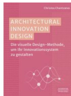
Architectural Innovation Design Ladenpreis: 41,20EUR