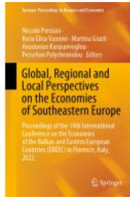
Global, Regional and Local Perspectives on the Economies of Southeastern Europe Ladenpreis: 186,99EUR