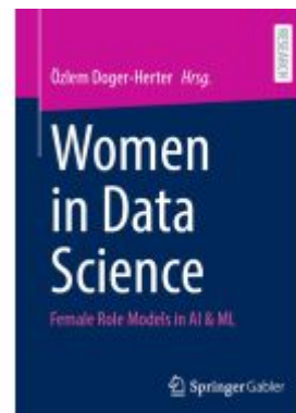
Women in Data Science Ladenpreis: 87,37EUR