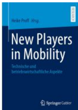
New Players in Mobility Ladenpreis: 185,04EUR