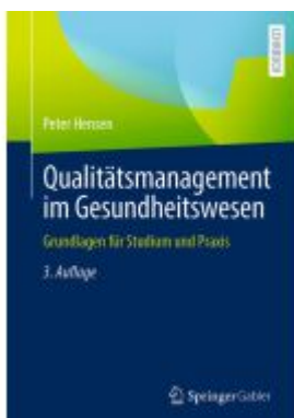
Qualitätsmanagement im Gesundheitswesen Ladenpreis: 41,11EUR