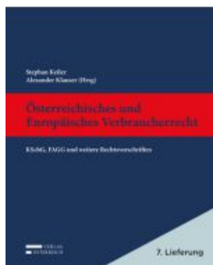
Österreichisches und Europäisches Verbraucherrecht Ladenpreis: 49,00EUR