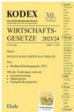
KODEX Wirtschafts-Gesetze Band I 2023/24 Ladenpreis: 62,00EUR