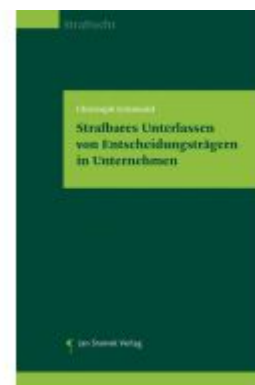
Strafbares Unterlassen von Entscheidungsträgern in Unternehmen Ladenpreis: 74,00EUR