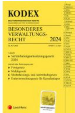
KODEX Besonderes Verwaltungsrecht 2024 - inkl. App Ladenpreis: 70,00EUR