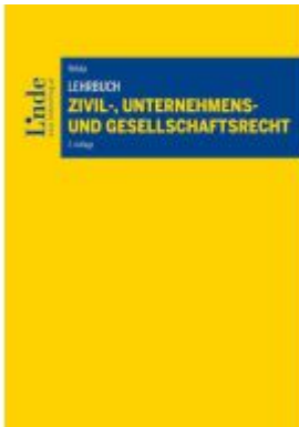
Lehrbuch Zivil-, Unternehmens- und Gesellschaftsrecht Ladenpreis: 55,00EUR