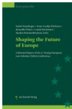
Shaping the Future of Europe Ladenpreis: 74,00EUR

Wir haben andere Produkte gefunden, die Ihnen gefallen könnten!