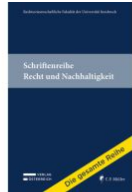
Schriftenreihe Recht und Nachhaltigkeit Ladenpreis: 1.000,00EUR