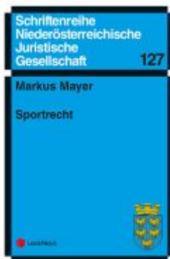
Sportrecht Ladenpreis: 11,00EUR