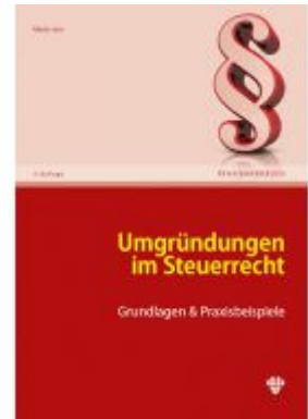
Umgründungen im Steuerrecht Ladenpreis: 59,40 EUR