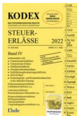
KODEX Steuer-Erlässe 2022, Band IV Ladenpreis: 63,00 EUR