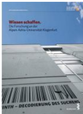
Wissen schaffen Ladenpreis: 24,90 EUR

Wir haben andere Produkte gefunden, die Ihnen gefallen könnten!