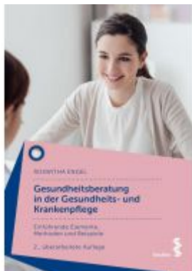
Gesundheitsberatung in der Gesundheits- und Krankenpflege Ladenpreis: 22,90 EUR