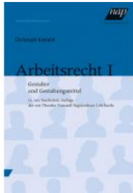
Arbeitsrecht I Ladenpreis: 29,90 EUR