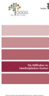
Die Hüftfraktur im interdisziplinären Kontext Ladenpreis: 5,70 EUR