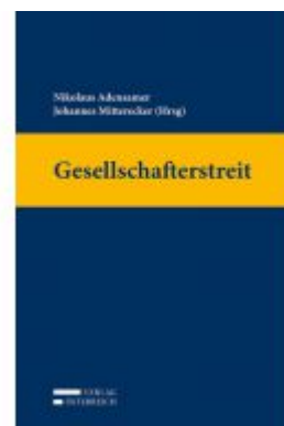
Gesellschafterstreit Ladenpreis: 249,00 EUR