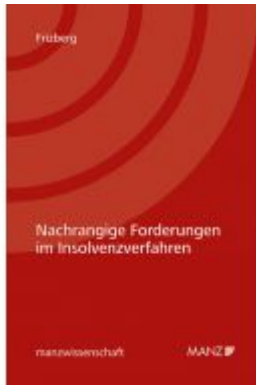
Nachrangige Forderungen im Insolvenzverfahren Ladenpreis: 62,00 EUR