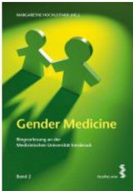
Gender Medicine Ladenpreis: 22,90 EUR