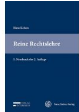
Reine Rechtslehre Ladenpreis: 79,00 EUR