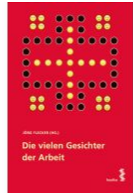
Die vielen Gesichter der Arbeit Ladenpreis: 29,00 EUR