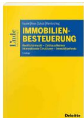
Immobilienbesteuerung Ladenpreis: 68,00 EUR