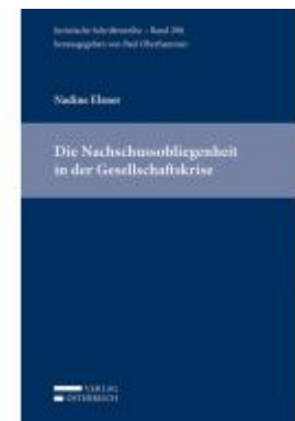
Die Nachschussobligation in der Gesellschaftskrise Ladenpreis: 79,00 EUR