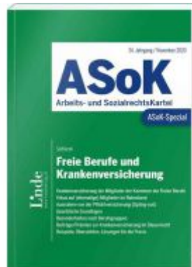
ASoK-Spezial Freie Berufe und Krankenversicherung Ladenpreis: 24,00 EUR