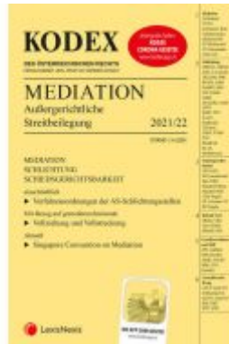
KODEX Mediation Ladenpreis: 32,00 EUR