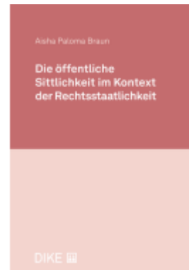
Die öffentliche Sittlichkeit im Kontext der Rechtsstaatlichkeit Ladenpreis: 108,00EUR