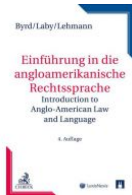
Einführung in die anglo-amerikanische Rechtssprache Ladenpreis: 39,00 EUR