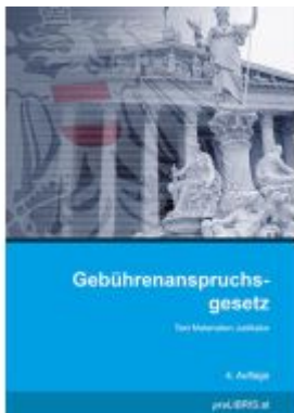
Gebührenanspruchsgesetz Ladenpreis: 25,00EUR