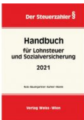
Handbuch für Lohnsteuer und Sozialversicherung 2021 Ladenpreis: 61,60 EUR