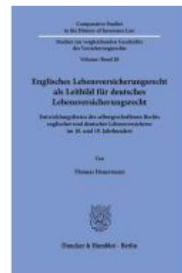
Englisches Lebensversicherungsrecht als Leitbild für deutsches Lebensversicherungsrecht. Ladenpreis: 113,00EUR