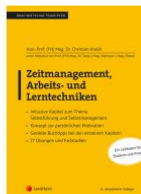
Zeitmanagement, Arbeits- und Lerntechniken Ladenpreis: 28,00 EUR