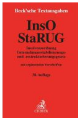
Insolvenzordnung / Unternehmensstabilisierungs- und - restrukturierungsgesetz Ladenpreis: 15,40EUR