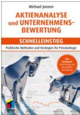
Aktienanalyse und Unternehmensbewertung - Schnelleinstieg Ladenpreis: 22,70EUR