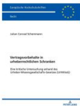
Vertragsvorbehalte in urheberrechtlichen Schranken Ladenpreis: 112,10EUR