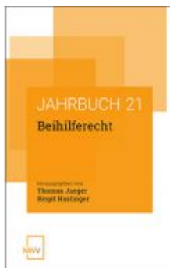
Beihilferecht Ladenpreis: 78,00 EUR