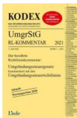
KODEX Umgründungssteuergesetz- Richtlinienkommentar 2021 Ladenpreis: 60,00 EUR