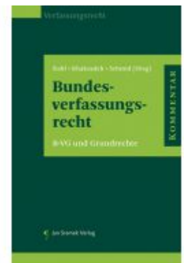
Kommentar zum Bundesverfassungsrecht Ladenpreis: 248,00 EUR