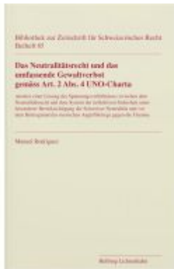
Das Neutralitätsrecht und das umfassende Gewaltverbot gemäss Art. 2 Abs. 4 UNO-Charta Ladenpreis: 42,00EUR