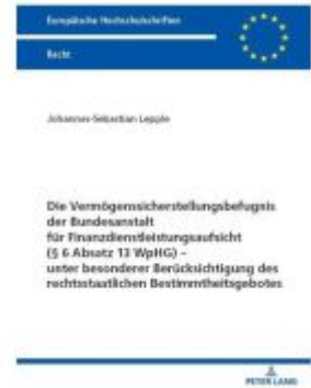
Die Vermögenssicherstellungsbefugnis der Bundesanstalt für Finanzdienstleistungsaufsicht (§ 6 Absatz 13 WpHG) – unter besonderer Berücksichtigung des rechtsstaatlichen Bestimmtheitsgebotes Ladenpreis: 46,20EUR