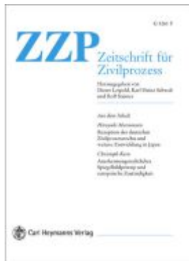
Zeitschrift für Zivilprozess International. ZFP Int. Jahrbuch des... / Zeitschrift für Zivilprozess International. Ladenpreis: 150,10EUR