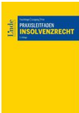
Praxisleitfaden Insolvenzrecht Ladenpreis: 79,00EUR