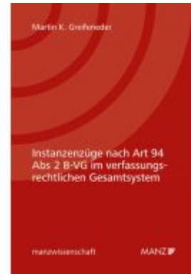
Instanzenzüge nach Art 94 Abs 2 B-VG im verfassungsrechtlichen Gesamtsystem Ladenpreis: 58,00EUR