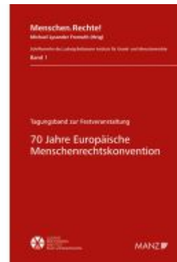
70 Jahre Europäische Menschenrechtskonvention Ladenpreis: 42,00EUR