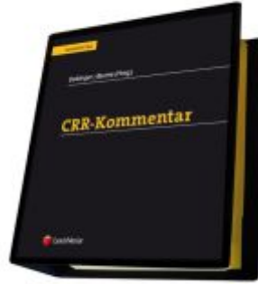
CRR-Kommentar Ladenpreis: 568,00EUR