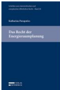
Das Recht der Energieräumplanung Ladenpreis: 109,00EUR