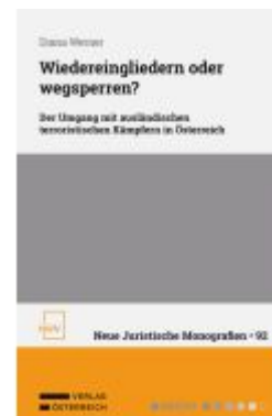
Wiedereingliedern oder wegsperren? Ladenpreis: 54,00EUR