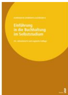
Einführung in die Buchhaltung im Selbststudium Ladenpreis: 52,00EUR