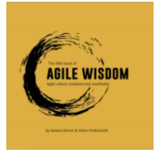
The Little Book of Agile Wisdom Ladenpreis: 19,99EUR