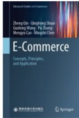
E-Commerce Ladenpreis: 76,99EUR