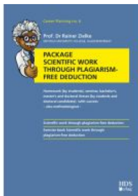
Package Scientific work through plagiarism-free deduction Ladenpreis: 50,30EUR