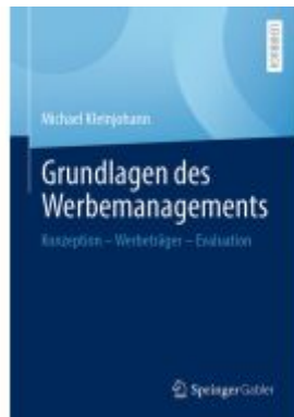
Grundlagen des Werbemanagements Ladenpreis: 71,95EUR