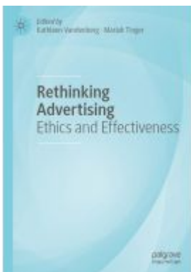
Rethinking Advertising Ladenpreis: 186,99EUR