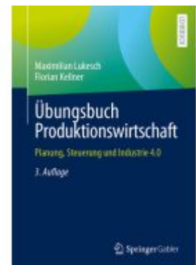
Übungsbuch Produktionswirtschaft Ladenpreis: 39,06EUR