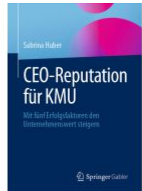
CEO-Reputation für KMU Ladenpreis: 61,67EUR