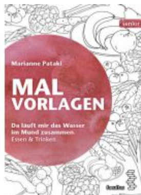
Malvorlagen Ladenpreis: 9,90 EUR