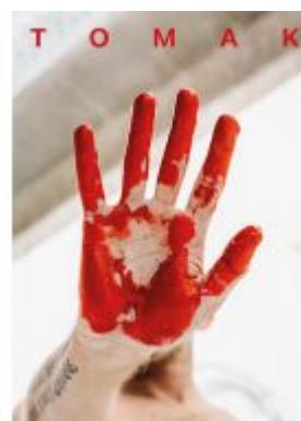
TOMAK Ladenpreis: 48,00 EUR