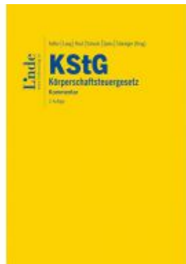
KStG | Körperschaftsteuergesetz Aktionspreis: 248,00 EUR Ladenpreis: 298,00 EUR