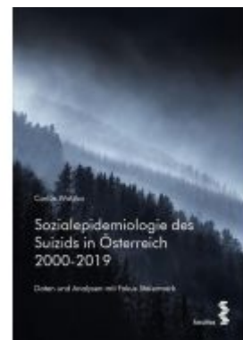
Sozialepidemiologie des Suizids in Österreich 2000-2019 Ladenpreis: 26,90 EUR