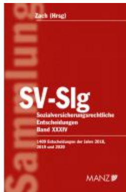
Sozialversicherungsrechtliche Entscheidungen SV-Slg Ladenpreis: 379,00 EUR