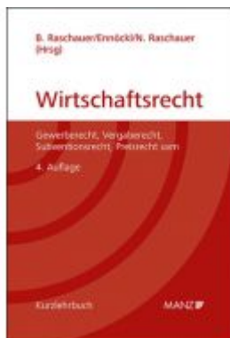
Grundriss des österreichischen Wirtschaftsrechts Ladenpreis: 93,00 EUR

Wir haben andere Produkte gefunden, die Ihnen gefallen könnten!