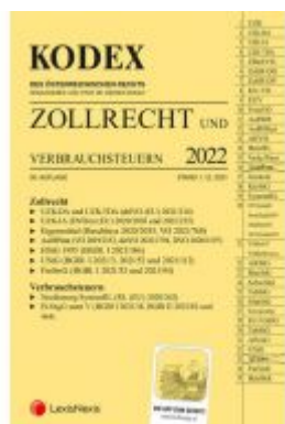
KODEX Zollrecht 2022 - inkl. App Ladenpreis: 116,00 EUR