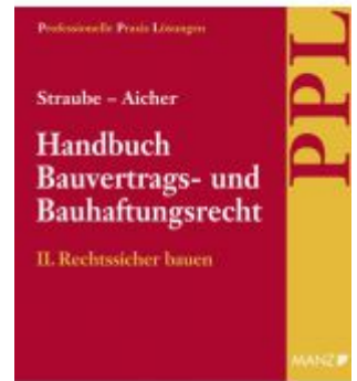
Handbuch Bauvertrags- und Bauhaftungsrecht Band II: Rechtssicher Bauen Ladenpreis: 148,00 EUR