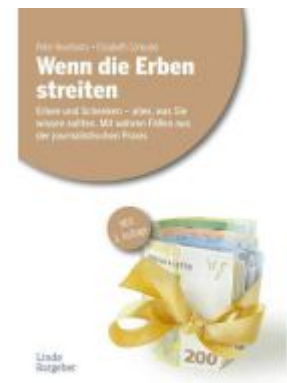
Wenn die Erben streiten Ladenpreis: 24,90EUR