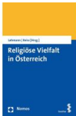
Religiöse Vielfalt in Österreich Ladenpreis: 50,40EUR