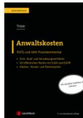
Anwaltskosten Ladenpreis: 139,00EUR