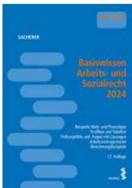
Basiswissen Arbeits- und Sozialrecht 2024 Ladenpreis: 40,00EUR