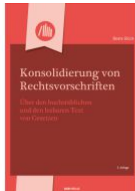
Konsolidierung von Rechtsvorschriften Ladenpreis: 36,00EUR