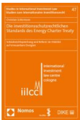
Die investitionsschutzrechtlichen Standards des Energy Charter Treaty Ladenpreis: 132,70EUR