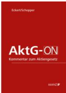
AktG-ON Ladenpreis: 298,00EUR

Wir haben andere Produkte gefunden, die Ihnen gefallen könnten!