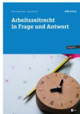
Arbeitszeitrecht in Frage und Antwort Ladenpreis: 36,00EUR