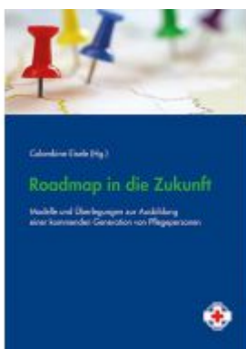
Roadmap in die Zukunft Ladenpreis: 14,90 EUR