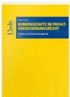
Kundenschutz im Privatversicherungsrecht Ladenpreis: 36,00 EUR

Wir haben andere Produkte gefunden, die Ihnen gefallen könnten!