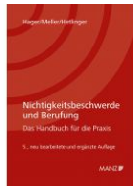
Nichtigkeitsbeschwerde und Berufung Ladenpreis: 79,00 EUR