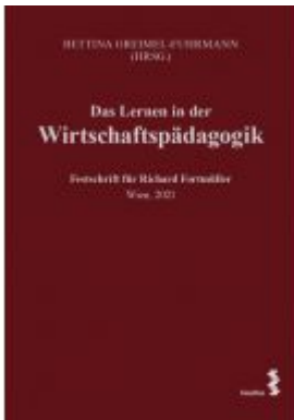
Das Lernen in der Wirtschaftspädagogik Ladenpreis: 34,00 EUR