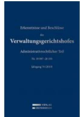
Erkenntnisse und Beschlüsse des Verwaltungsgerichtshofes Ladenpreis: 419,00 EUR