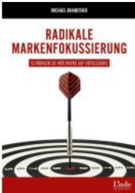
Radikale Markenfokussierung Ladenpreis: 29,90 EUR