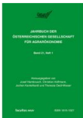
Diversifizierung versus Spezialisierung in der Agrar- und Ernährungswirtschaft Ladenpreis: 17,90 EUR