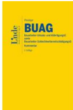
BUAG | Bauarbeiter-Urlaubs- und Abfertigungsgesetz sowie Bauarbeiter- Schlechtwetterentschädigungsgesetz Ladenpreis: 108,00 EUR