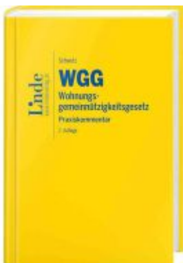
WGG | Wohnungsgemeinnützigkeitsgesetz Ladenpreis: 99,00EUR

Wir haben andere Produkte gefunden, die Ihnen gefallen könnten!