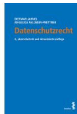
Datenschutzrecht Ladenpreis: 28,00EUR