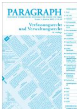
Paragraph - Verfassungs- und Verwaltungsrecht Ladenpreis: 18,90EUR