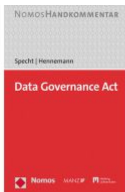
Data Governance Act Ladenpreis: 132,60EUR