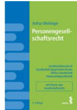
Personengesellschaftsrecht Ladenpreis: 28,00EUR