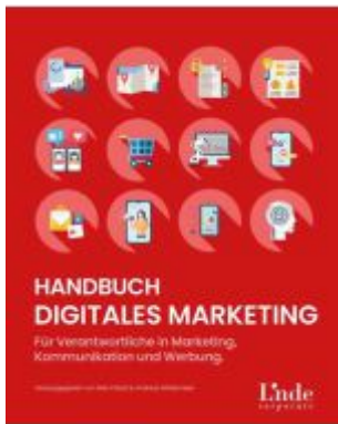
Handbuch Digitales Marketing Ladenpreis: 39,90EUR