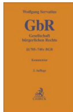
Gesellschaft bürgerlichen Rechts Ladenpreis: 163,50EUR