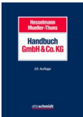
Handbuch GmbH & Co. KG Ladenpreis: 184,10EUR