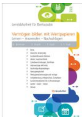
Vermögen bilden mit Wertpapieren Ladenpreis: 28,80EUR