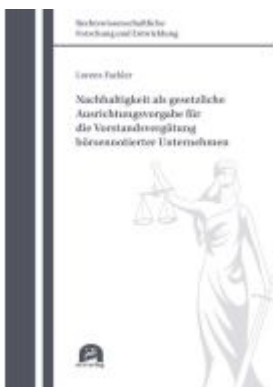
Nachhaltigkeit als gesetzliche Ausrichtungsvorgabe für die Vorstandsvergütung börsennotierter Unternehmen Ladenpreis: 71,00EUR