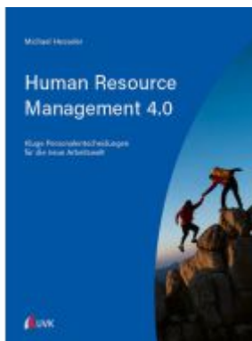
Human Resource Management 4.0 Ladenpreis: 53,60EUR