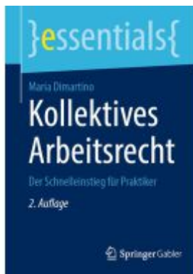
Kollektives Arbeitsrecht Ladenpreis: 15,41EUR