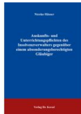
Auskunfts- und Unterrichtungspflichten des Insolvenzverwalters gegenüber einem absonderungsberechtigten Gläubiger Ladenpreis: 91,40EUR