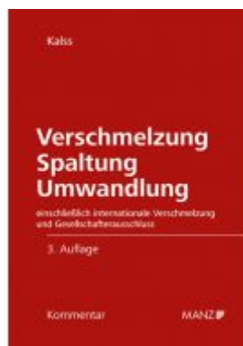
Verschmelzung Spaltung Umwandlung Ladenpreis: 298,00 EUR