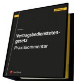
Vertragsbedienstetengesetz - Praxiskommentar Ladenpreis: 330,00 EUR