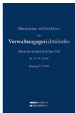
Erkenntnisse und Beschlüsse des Verwaltungsgerichtshofes Ladenpreis: 392,00 EUR