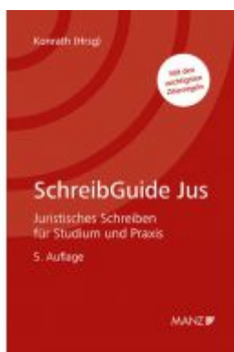
SchreibGuide Jus Ladenpreis: 44,00 EUR