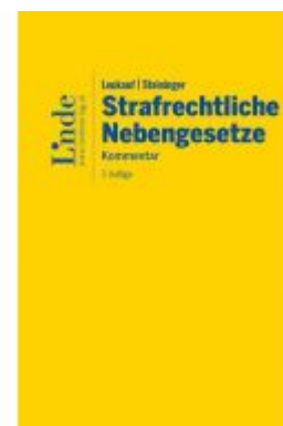
Leukauf/Steininger Strafrechtliche Nebengesetze Ladenpreis: 198,00 EUR