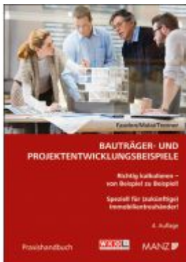
Bauträger- und Projektentwicklungsbeispiele Ladenpreis: 46,00 EUR

Wir haben andere Produkte gefunden, die Ihnen gefallen könnten!