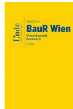
BauR Wien | Wiener Baurecht Ladenpreis: 120,00 EUR