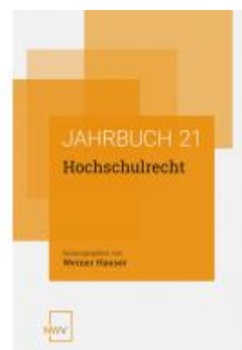
Hochschulrecht Ladenpreis: 68,00 EUR