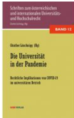
Die Universität in der Pandemie Ladenpreis: 34,00 EUR