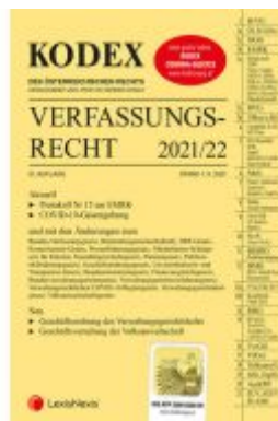
KODEX Verfassungsrecht 2021/22 - inkl. App Ladenpreis: 40,00 EUR