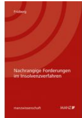
Nachrangige Forderungen im Insolvenzverfahren Ladenpreis: 62,00 EUR