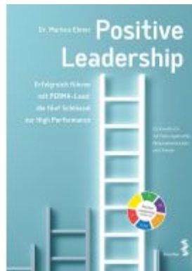
Positive Leadership Ladenpreis: 39,90 EUR