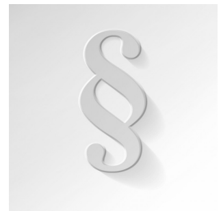
Das Recht der Kuratoren Ladenpreis: 84,00 EUR