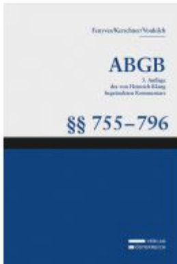
Großkommentar zum ABGB - Klang Kommentar Ladenpreis: 132,00 EUR