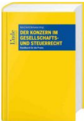
Der Konzern im Gesellschafts- und Steuerrecht Ladenpreis: 185,00 EUR