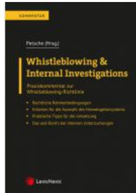
Whistleblowing & Internal Investigations Ladenpreis: 49,00 EUR