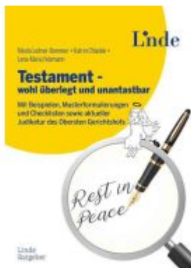
Testament - wohl überlegt und unantastbar Ladenpreis: 19,90EUR

Wir haben andere Produkte gefunden, die Ihnen gefallen könnten!