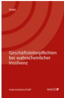
Geschäftsleiterpflichten bei wahrscheinlicher Insolvenz Ladenpreis: 118,00EUR