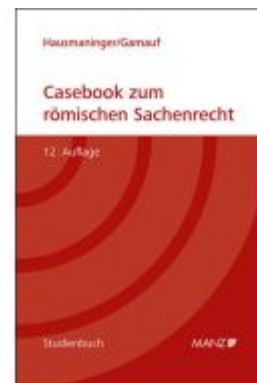
Casebook zum römischen Sachenrecht Ladenpreis: 37,00EUR