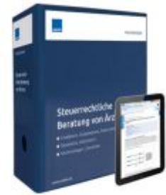
Steuerrechtliche Beratung von Ärzten Ladenpreis: 250,80EUR