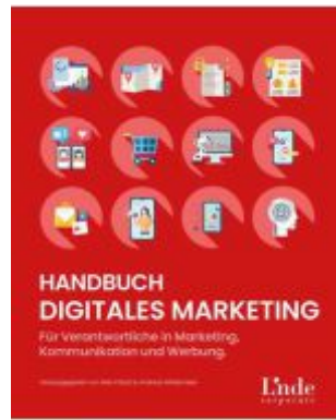
Handbuch Digitales Marketing Ladenpreis: 39,90EUR