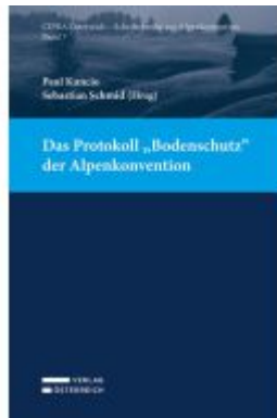
Das Protokoll „Bodenschutz“ der Alpenkonvention Ladenpreis: 45,00EUR