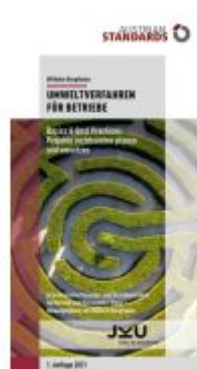
Umweltverfahren für Betriebe Ladenpreis: 27,50EUR