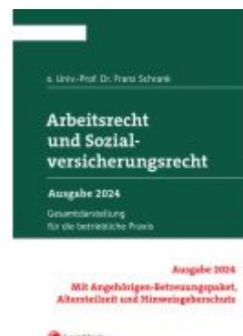
Arbeitsrecht und Sozialversicherungsrecht 2024 Ladenpreis: 373,00EUR