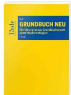
Grundbuch NEU Ladenpreis: 69,00 EUR