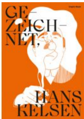
Gezeichnet, Hans Kelsen Ladenpreis: 19,00 EUR