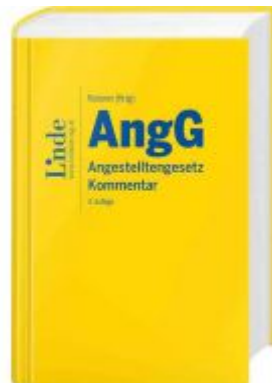
AngG | Angestelltengesetz Ladenpreis: 155,00 EUR