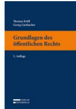
Grundlagen des öffentlichen Rechts Ladenpreis: 35,00 EUR