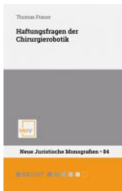
Haftungsfragen der Chirurgierobotik Ladenpreis: 54,00 EUR