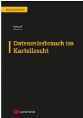
Datenmissbrauch im Kartellrecht Ladenpreis: 49,00 EUR

Wir haben andere Produkte gefunden, die Ihnen gefallen könnten!