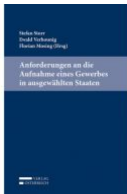
Anforderungen an die Aufnahme eines Gewerbes in ausgewählten Staaten Ladenpreis: 64,00 EUR