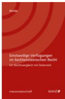
Einstweilige Verfügungen im liechtensteinischen Recht Ladenpreis: 48,00EUR