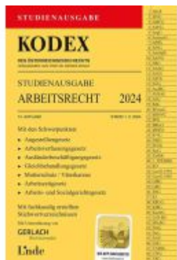
KODEX Studienausgabe Arbeitsrecht 2024 Ladenpreis: 15,00EUR

Wir haben andere Produkte gefunden, die Ihnen gefallen könnten!