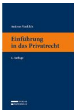
Einführung in das Privatrecht Ladenpreis: 23,00EUR