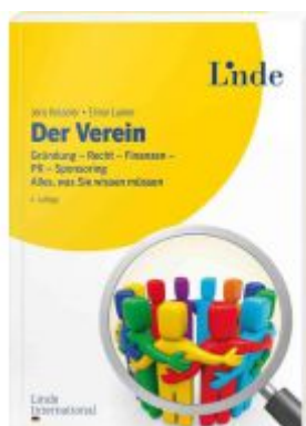
Der Verein Ladenpreis: 16,90EUR