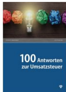
100 Antworten zur Umsatzsteuer Ladenpreis: 39,60EUR