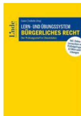
Lern- und Übungssystem Bürgerliches Recht Ladenpreis: 50,00EUR