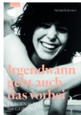
Irgendwann geht auch das vorbei Ladenpreis: 24,00EUR