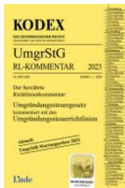
KODEX Umgründungssteuergesetz- Richtlinienkommentar 2023 Ladenpreis: 61,00EUR