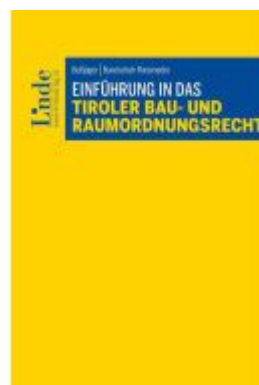
Einführung in das Tiroler Bau- und Raumordnungsrecht Ladenpreis: 49,00EUR