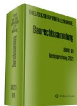
Baurechtssammlung. Rechtsprechung des Bundesverwaltungsgerichts,... / Baurechtssammlung Band 89 Ladenpreis: 203,60EUR