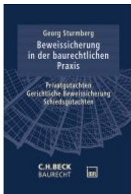
Die Beweissicherung in der baurechtlichen Praxis Ladenpreis: 81,30EUR