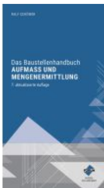
Das Baustellenhandbuch Aufmaß und Mengenermittlung Ladenpreis: 111,10EUR