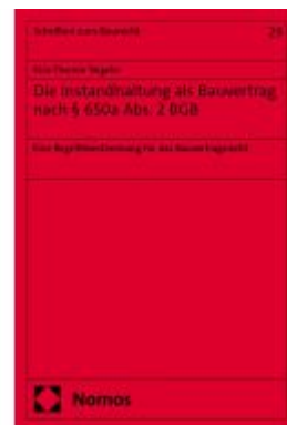
Die Instandhaltung als Bauvertrag nach § 650a Abs. 2 BGB Ladenpreis: 81,30EUR