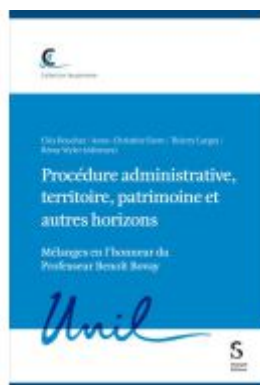
Procédure administrative, territoire, patrimoine et autres horizons Ladenpreis: 194,00EUR