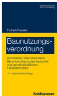
Baunutzungsverordnung Ladenpreis: 153,00EUR