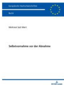
Selbstvornahme vor der Abnahme Ladenpreis: 41,10EUR