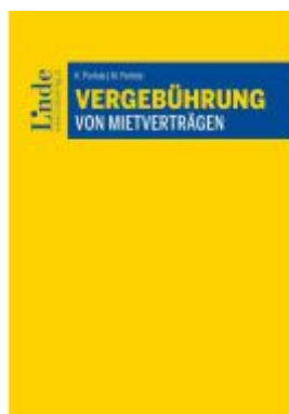
Vergebührung von Mietverträgen Ladenpreis: 25,00EUR