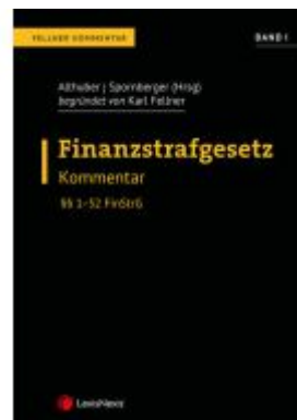
FinStrG Finanzstrafgesetz – Fellner Kommentar Band I Ladenpreis: 219,00EUR