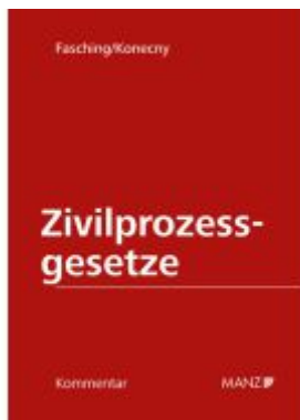
PAKET: Kommentar zu den Zivilprozessgesetzen 3. Auflage Band 1+2/1+2/2+2/3+3/1+3/2+4/1+4/2+5/1+5/2+ 5/3+5/4 Ladenpreis: 2.610,00EUR