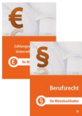
Set für Bilanzbuchhalter Ladenpreis: 60,50EUR