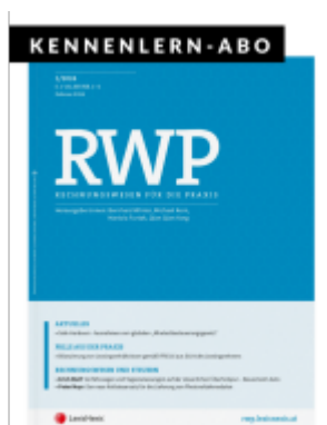
RWP Zeitschrift - Kennenlern-Abo (2 Hefte) Ladenpreis: 20,00EUR