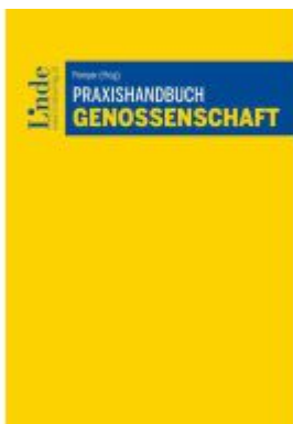
Praxishandbuch Genossenschaft Ladenpreis: 78,00EUR