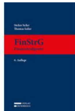
FinStrG - Finanzstrafgesetz Ladenpreis: 199,00EUR