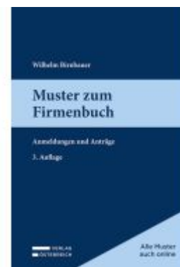
Muster zum Firmenbuch Ladenpreis: 69,00EUR