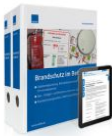
Brandschutz im Betrieb Ladenpreis: 239,80EUR