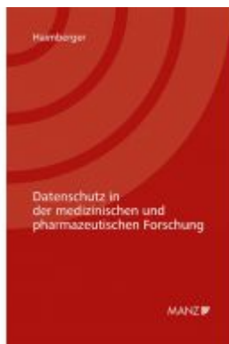
Datenschutz in der medizinischen und pharmazeutischen Forschung Ladenpreis: 64,00 EUR