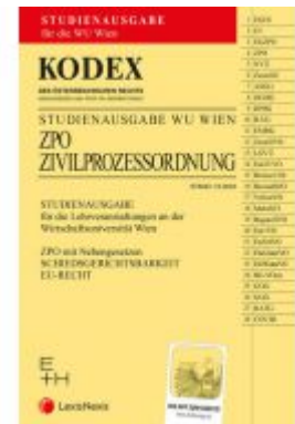
KODEX ZGV für die WU 2022/23 - inkl. App Ladenpreis: 16,00 EUR