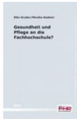
Gesundheit und Pflege an die Fachhochschule? Ladenpreis: 4,90 EUR