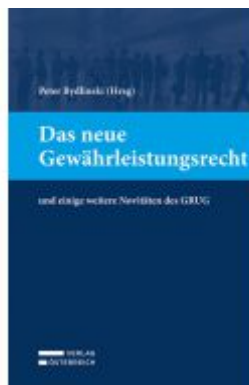
Das neue Gewährleistungsrecht Ladenpreis: 59,00 EUR