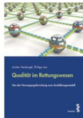
Qualität im Rettungswesen Ladenpreis: 21,90 EUR