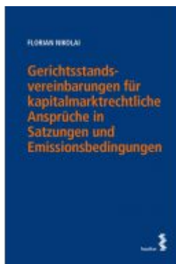
Gerichtsstandsvereinbarungen für kapitalmarktrechtliche Ansprüche in Satzungen und Emissionsbedingungen Ladenpreis: 38,00 EUR