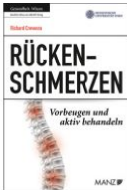
Rückenschmerzen Vorbeugen und aktiv behandeln Ladenpreis: 23,90 EUR

Wir haben andere Produkte gefunden, die Ihnen gefallen könnten!