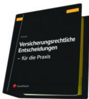
Versicherungsrechtliche Entscheidungen - aufbereitet für die Praxis Ladenpreis: 329,00 EUR