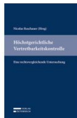
Höchstgerichtliche Vertretbarkeitskontrolle Ladenpreis: 49,00EUR