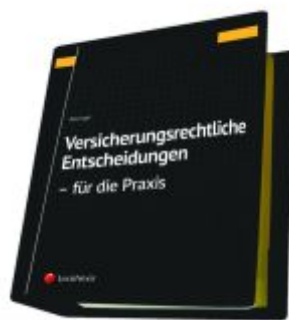
Versicherungsrechtliche Entscheidungen - aufbereitet für die Praxis Ladenpreis: 329,00EUR