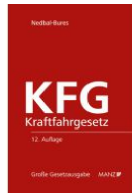
Kraftfahrzeuggesetz - KFG Ladenpreis: 138,00EUR