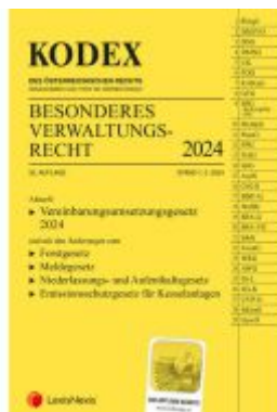
KODEX Besonderes Verwaltungsrecht 2024 - inkl. App Ladenpreis: 70,00EUR