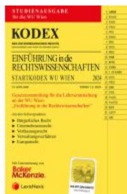
KODEX Einführung in die Rechtswissenschaften 2024 - inkl. App Ladenpreis: 12,00EUR