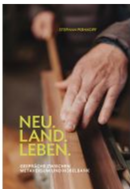
Neu.Land.Leben Ladenpreis: 25,00EUR

Wir haben andere Produkte gefunden, die Ihnen gefallen könnten!