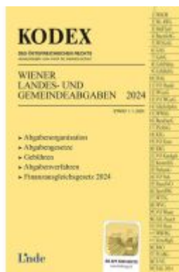
KODEX Wiener Landes- und Gemeindeabgaben Ladenpreis: 29,00EUR