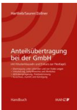
Anteilsübertragung bei der GmbH Ladenpreis: 132,00EUR