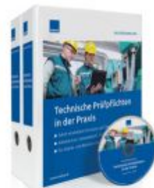
Technische Prüfpflichten in der Praxis Ladenpreis: 217,80 EUR