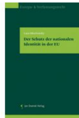
Der Schutz der nationalen Identität in der EU Ladenpreis: 78,00 EUR