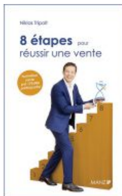
8 étapes pour réussir une vente Ladenpreis: 28,90 EUR