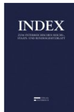
Index Ladenpreis: 389,00 EUR