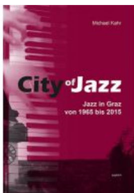
City of Jazz – Jazz in Graz von 1965 bis 2015 Ladenpreis: 29,90 EUR