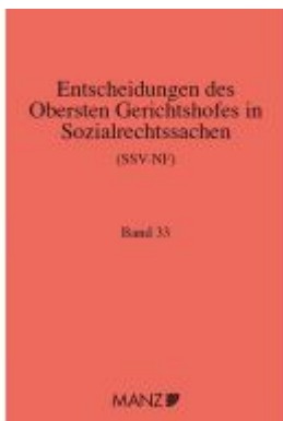
Entscheidungen des obersten Gerichtshofes in Sozialrechtssachen SSV- NF Ladenpreis: 139,20 EUR