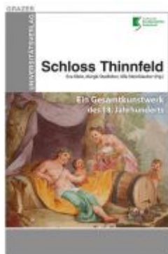
Schloss Thinnfeld Ladenpreis: 22,00 EUR

Wir haben andere Produkte gefunden, die Ihnen gefallen könnten!