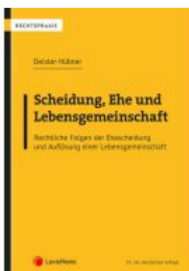
Scheidung, Ehe und Lebensgemeinschaft Ladenpreis: 79,00EUR