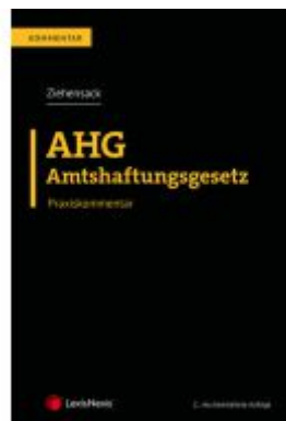
AHG - Amtshaftungsgesetz Ladenpreis: 279,00EUR