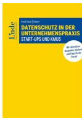
Datenschutz in der Unternehmenspraxis Ladenpreis: 55,00EUR