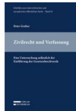
Zivilrecht und Verfassung Ladenpreis: 58,00EUR

Alle Preise inkl. MwSt. zzgl. Versand. Bei Bestellung im LexisNexis Onlineshop kostenloser Versand innerhalb Österreichs.