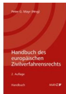
Handbuch des europäischen Zivilverfahrensrechts Ladenpreis: 268,00EUR