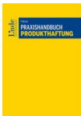
Praxishandbuch Produkthaftung Ladenpreis: 39,00EUR