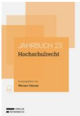
Hochschulrecht Ladenpreis: 78,00EUR

Wir haben andere Produkte gefunden, die Ihnen gefallen könnten!