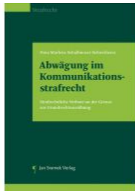
Abwägungen im Kommunikationsstrafrecht Ladenpreis: 148,00EUR