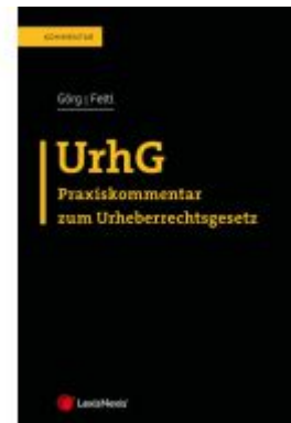
UrHG Ladenpreis: 124,00EUR