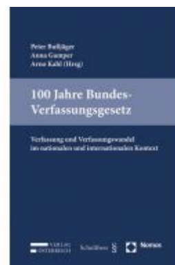
100 Jahre Bundes-Verfassungsgesetz Ladenpreis: 49,00 EUR