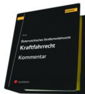
Österreichisches Straßenverkehrsrecht - Kraftfahrrecht Ladenpreis: 487,00 EUR