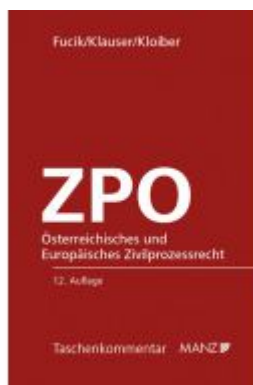
Österreichisches und Europäisches Zivilprozessrecht - ZPO Ladenpreis: 79,00 EUR