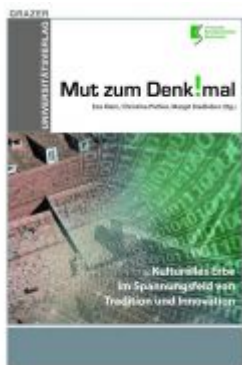
Mut zum Denkmal – Kulturelles Erbe im Spannungsfeld von Tradition und Innovation Ladenpreis: 28,00 EUR