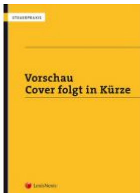
BAO 2020/2021 Ladenpreis: 50,00 EUR

Wir haben andere Produkte gefunden, die Ihnen gefallen könnten!