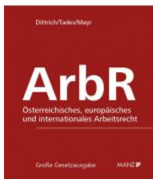
Arbeitsrecht Ladenpreis: 338,00 EUR