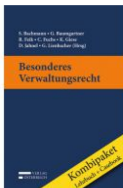
Kombipaket Besonderes Verwaltungsrecht Ladenpreis: 78,00 EUR