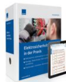
Elektrosicherheit in der Praxis Ladenpreis: 273,90 EUR