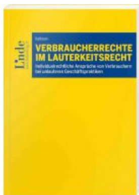
Verbraucherrechte im Lauterkeitsrecht Ladenpreis: 59,00EUR