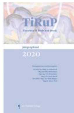
TiRuP - Tierschutz in Recht und Praxis Ladenpreis: 59,90EUR