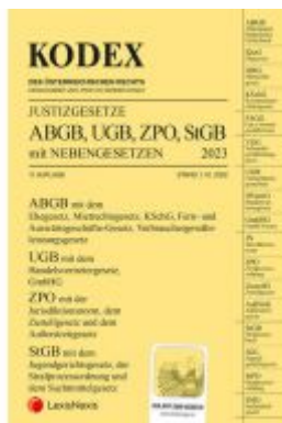
KODEX Justizgesetze 2023 - inkl. App Ladenpreis: 32,00EUR