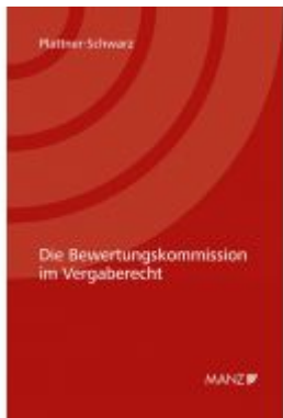
Die Bewertungskommission im Vergaberecht Ladenpreis: 118,00EUR

Wir haben andere Produkte gefunden, die Ihnen gefallen könnten!