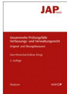
Gesammelte Prüfungsfälle Verfassungs- und Verwaltungsrecht Ladenpreis: 33,00EUR