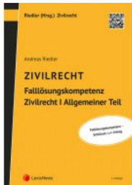
Falllösungskompetenz ZR I AT Ladenpreis: 29,00EUR