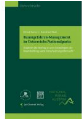
Baumgefahren-Management in Österreichs Nationalparks Ladenpreis: 39,90EUR