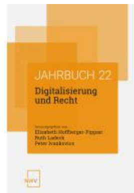
Digitalisierung und Recht Ladenpreis: 84,00EUR