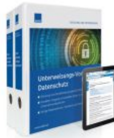
Unterweisungs-Vorlagen Datenschutz Ladenpreis: 239,80EUR