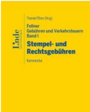
Felner Gebühren und Verkehrssteuern, Band I: Stempel- und Rechtsgebühren Ladenpreis: 132,00EUR

Wir haben andere Produkte gefunden, die Ihnen gefallen könnten!