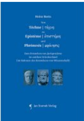
Von Téchne zu Epistème und Phrónesis Ladenpreis: 48,00EUR