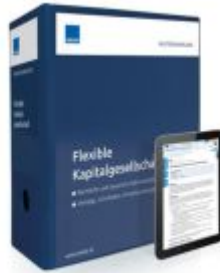
Mustersammlung Flexible Kapitalgesellschaft Ladenpreis: 250,80EUR