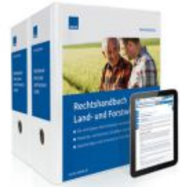
Rechtshandbuch Land- und Forstwirtschaft Ladenpreis: 239,80EUR