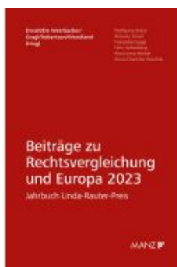
Beiträge zur Rechtsvergleichung und Europa 2023 Jahrbuch Linda-Rauter-Preis Ladenpreis: 94,00EUR