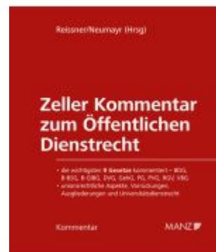
Zeller Kommentar zum Öffentlichen Dienstrecht Ladenpreis: 338,00EUR