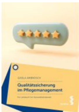
Qualitätssicherung im Pflegemanagement Ladenpreis: 24,90EUR