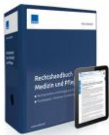
Rechtshandbuch Medizin und Pflege Ladenpreis: 239,80EUR

Wir haben andere Produkte gefunden, die Ihnen gefallen könnten!