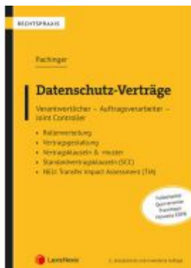
Datenschutz-Verträge Ladenpreis: 49,00EUR