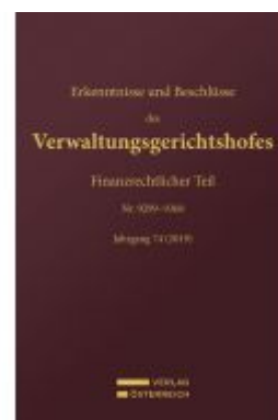
Erkenntnisse und Beschlüsse des Verwaltungsgerichtshofes Französischer Teil Ladenpreis: 189,00EUR