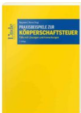
Praxisbeispiele zur Körperschaftsteuer Ladenpreis: 45,00EUR