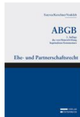
Großkommentar zum ABGB - Klang Kommentar Ladenpreis: 565,00EUR