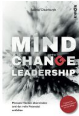
MIND CHANGE LEADERSHIP® Ladenpreis: 18,70EUR