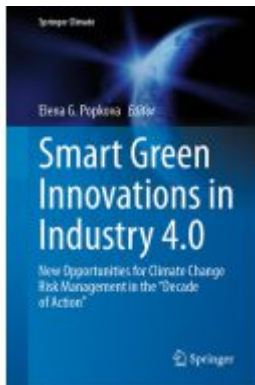
Smart Green Innovations in Industry 4.0