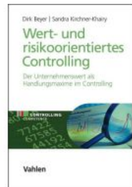
Wert- und risikoorientiertes Controlling Ladenpreis: 46,20EUR