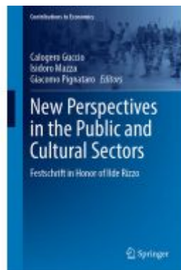
New Perspectives in the Public and Cultural Sectors Ladenpreis: 175,99EUR