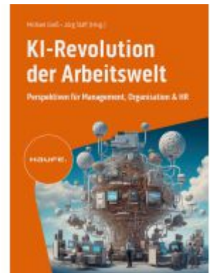
KI-Revolution der Arbeitswelt