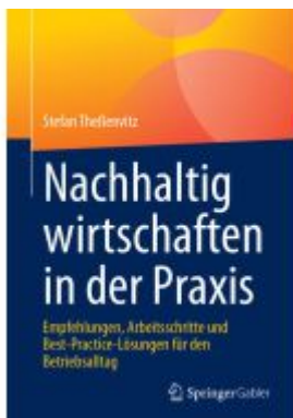
Nachhaltig wirtschaften in der Praxis Ladenpreis: 35,97EUR