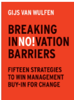
Breaking Innovation Barriers