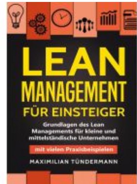
Lean Management für Einsteiger Ladenpreis: 16,40EUR