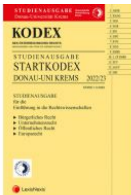
KODEX Startkodex KREMS 2022/23 - inkl. App Ladenpreis: 28,00EUR

Wir haben andere Produkte gefunden, die Ihnen gefallen könnten!