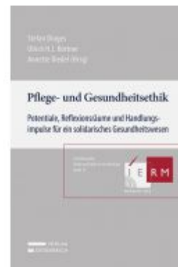
Pflege- und Gesundheitsethik Ladenpreis: 59,00EUR