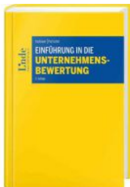
Einführung in die Unternehmensbewertung Ladenpreis: 85,00EUR