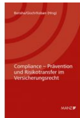
Compliance - Prävention und Risikotransfer im Versicherungsrecht 7. Kremser Versicherungsforum 2021 Ladenpreis: 36,00EUR