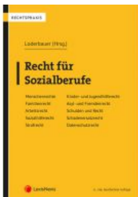
Recht für Sozialberufe Ladenpreis: 62,00EUR