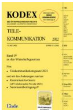
KODEX Telekommunikation 2022 Ladenpreis: 83,00EUR