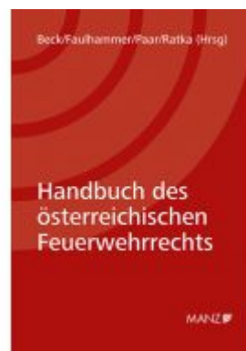
Handbuch des österreichischen Feuerwehrrchts Ladenpreis: 52,00EUR