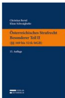
Österreichisches Strafrecht. Besonderer Teil II (§§ 169 bis 321k StGB) Ladenpreis: 39,00EUR