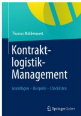
Kontraktlogistik-Management Ladenpreis: 46,26EUR